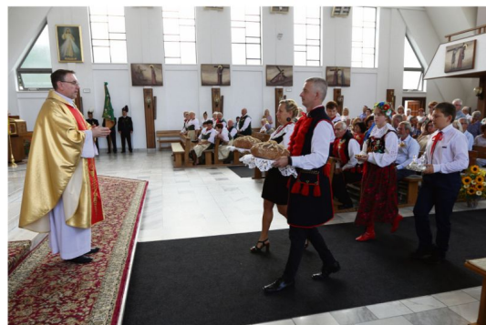
Rajsko, 28 sierpnia, msza dożynkowa w kościele parafialnym.