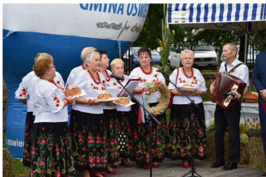
Brzezinka, 27 sierpnia, stadion LKS Iskra. Zespół Brzezinianki tworzą gospodynie miejscowego Koła.