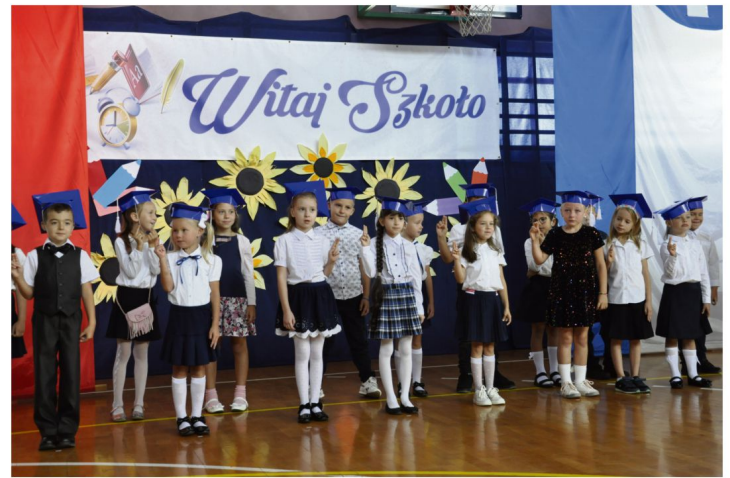
Ślubowanie pierwszoklasistów w Szkole Podstawowej w Rajsku.

Znalezienie wspomnianych specjalistów było dla dyrektorów placówek oświatowych poważnym wyzwaniem. Pod koniec sierpnia trzy