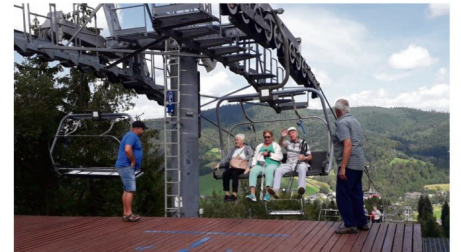
Wycieczka do Wisły, sierpień 2022.