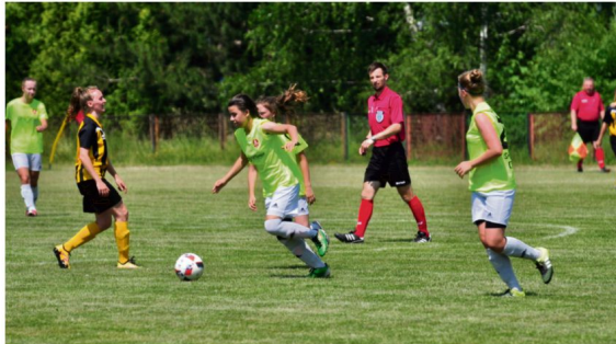
W rundzie jesiennej przed własną publicznością Iskierki rozegrają jeszcze cztery spotkania. Najbliższy mecz 10 września z rezerwami Resovii.