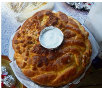
Obrzędowy, ukraiński chleb – korowaj.