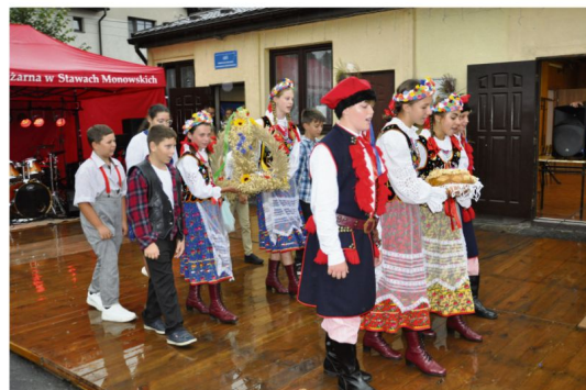
Stawy Monowskie, 20 sierpnia, scena przed remizą OSP. Młodzieży ani dorosłych mieszkańców nie przestraszyła kapryśna pogoda.