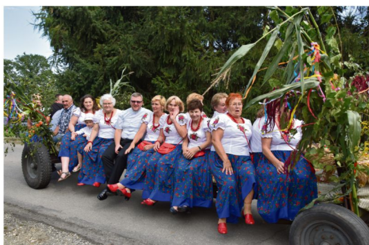
Pławy, 27 sierpnia. Korowód przejechał ul. Pławianka z altany przy placu zabaw na zielenc przy Domu Ludowym.