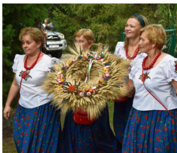
Pławy, 27 sierpnia. Gospodynie miejscowego Koła z wieńcem.