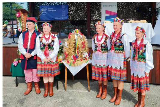
Włosienica, 27 sierpnia. Chłopcy i dziewczęta przed sceną przy remizie OSP.