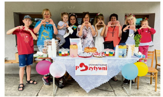
Stół z naszymi smakołykami.