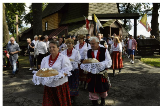
Poręba Wielka, 14 sierpnia, pl. ks. Hanusiaka. Po dziękczynnej mszy formuje się korowód.