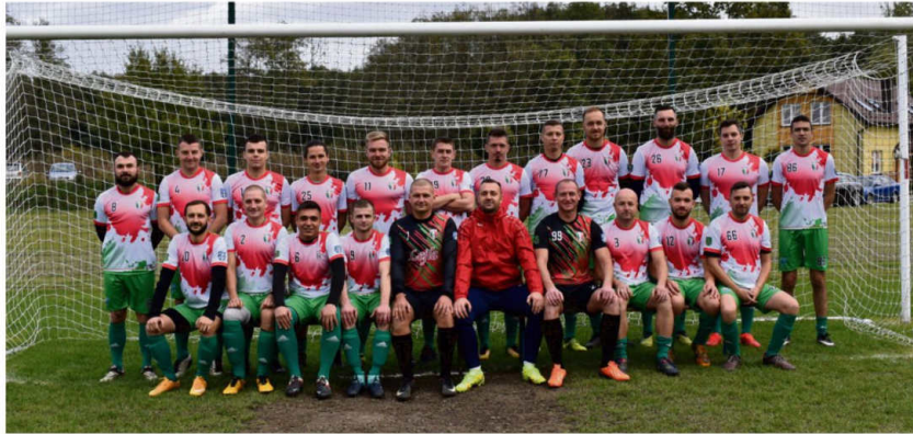
W rundzie jesiennej rozgrywek oświęcimskiej klasy B seniorski zespół Poręby Wielkiej zachował miano niepokonanego.