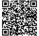
Kod QR Przegląd kołęd

Niepubliczne Przedszkole Smyk przysłało do "Oświęcimskiej Gminy" posłańców z ważną wiadomością. Do redakcji przybieżeli pastuszkowie z zalakowanym listem napisanym na czerpanym papierze.