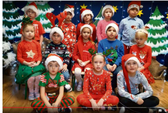
Fot. Kadr z kołędowania Żabek z Rajska.

świąteczną. Dzięki licznemu udziałowi dzieci ta piękna tradycja kołędowania jest nadal żywa”.