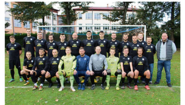
Drużyna Zaborzanki Zaborze przystąpi do rundy wiosennej z piątego miejsca zajmowanego na półmetku rozgrywek oświęcimskiej klasy B.