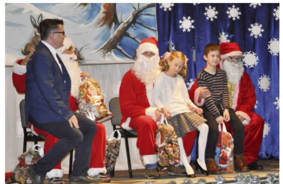
Magia Świąt w Rajsku.