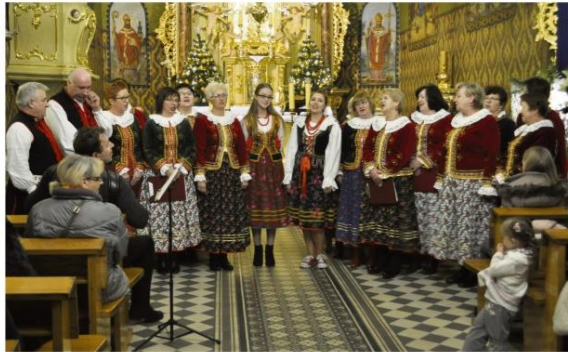
Koncert „Porębian”

Mieszkańcy Poręby Wielkiej kołędowali w niedzielę 7 stycznia. Po wieczornym nabożeństwie w zabytkowym kościele św. Bartłomieja wierni śpiewali kolędy razem z Zespołem "Porębianie", który przygotował na tę okazję specjalny program.