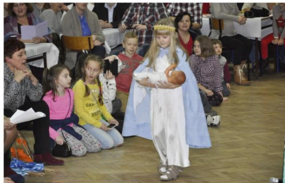
Kolędniczy z Brzezinki.

Najmłodszy brzeziniak śpiewał z takim zaangażowaniem i pasją, jakie