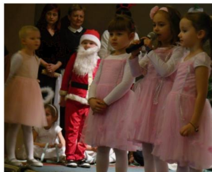
Przedszkolny kiermasz w Rajsku.

15 grudnia sala Domu Ludowego w Rajsku zamieniła się w „Przedszkolny Kiermasz Bożonarodzeniowy”. Na specjalnie przygotowanych stoiskach znalazły się piękne, własnoręcznie