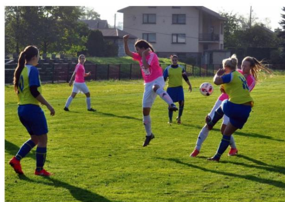
Po pierwszej rundzie rozgrywek trzeciej ligi kobiecej Iskra Brzezinka zajmuje drugie miejsce w tabeli.

W rundzie jesiennej dużym problemem były zawirowania związane z pogodą, wycofaniem się Glinika Gorlice oraz niestawieniem się na meczu ekipy z Tuchowa. To spowodowało, że Iskierki w środku sezonu pozostawały przez