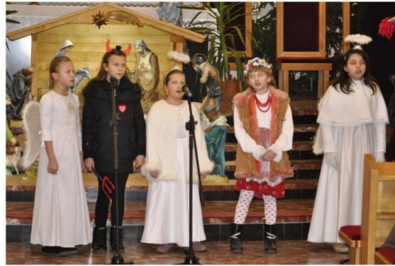
Zespół "Trojak" z Poręby Wielkiej.

Kołodowanie – również w naszej gminie – trwa przez cały styczeń, aż do Święta Ofiarowania Pańskiego nazywanego w Polsce Dniem Matki