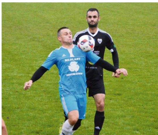
Na półmetku rozgrywek oświęcimskiej klasy A piłkarze z Rajksa zajmują trzecie miejsce w tabeli.

Skoro jesteśmy już przy solarzach, to wiadomo, że ze sponsorowania trzecioligowej drużyny z Plant wycofał się tytułarny sponsor. Zawodnicy