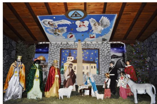
Szopka we Włosienicy.

W Konkursie na Najpiękniejszą Świąteczną Dekorację – tak jak w ubiegłorocznym – zwyciężyła Włosienica. Drugie miejsce zajęły Stawy Monowskie, a trzecie Poręba Wielka. Wyróżnione zostały Zaborze i Broszkowice. Coroczny Konkurs organizuje Ośrodek Kultury, Sportu i Rekreacji.