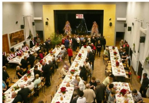
Grojccy Emeryci.

Zespół "Grojczanie" najpierw przypomniał mniej znane świąteczne pieśni, takie jak "To już pora na wigilię", czy "Zaspiewajmy kolędę Jezusowi dziś". Cała sala podjęła na stojąco "Przybieżeli do Betlejem" i "Bóg się rodzi". Po tej śpiewanej rozgrzewce przyszedł czas na nagrody dla dzieci i młodych.