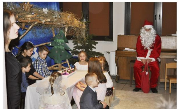
Wioska Dziecięca w Rajsku.

niezwykle dojrzałe i zarazem radosne Jasełka. 21 grudnia przedstawienie w przytulnej sali w Przedszkolu Samorządowym razem z dziećmi podziwiali samorządowcy.