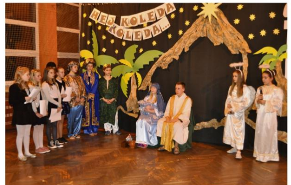
Jasełka w Szkole Podstawowej w Babicach.