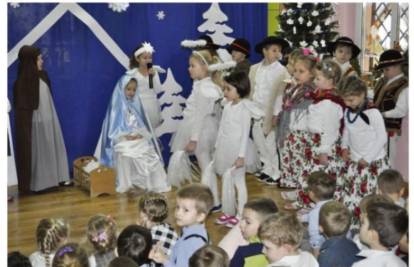
Przedszkolne Jasełka w Zaborzu.

Najmłodzi zaborzanie przygotowali z pomocą swoich nauczycielek